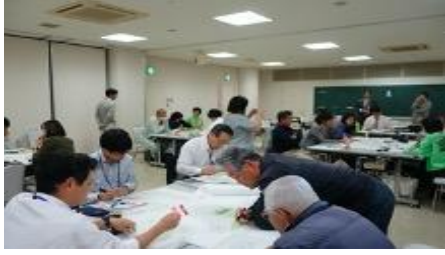
圖 4 學生參加居民工作坊的狀況